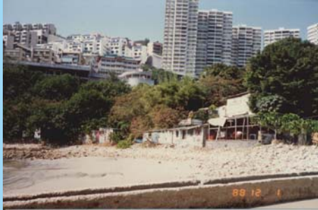
泳滩曾有一条碍眼的排水渠把污水引到泳滩范围。