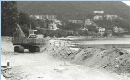
政府进行改善工程，取缔有关的排水渠，并把受污染的雨水引离泳滩以改善环境。